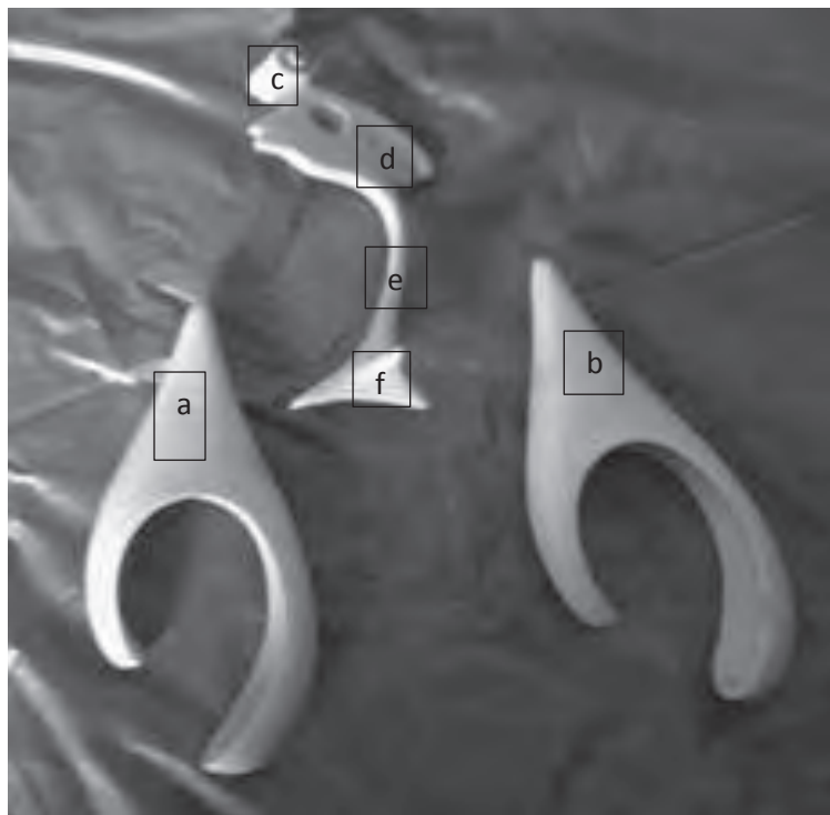
Fotografía 1. Ventriculos encefálicos. a) Ventrículo lateral izquierdo; b) ventrículo lateral derecho; c) conducto interventricular; d) tercer ventrículo; e) acueducto mesencefálico y f) cuarto ventrículo.

En el estudio adelantado por los autores Martínez et al. (2006), en el que aplicaron la técnica de inyección y de corrosión, utilizando ácido sulfúrico al 98% y encéfalos fijados previamente en formol al 5%, los modelos fueron de menor calidad, con rugosidades y arquitectura anatómica deficiente. De igual modo, no se estimó el grado de fidelidad final con respecto a la pieza o molde patrón; además, se destaca, en dicho estudio, que por el diámetro del acueducto mesencefálico durante la salida del molde, se presentaron daños en el tejido, los cuales, fueron corregidos con el uso de un alambre, comunicando el tercer y cuarto ventrículo, que se recubrió con resina, razón por la cual, se destinaron las piezas para docencia mas no para investigación. De igual forma, de las tres piezas, una presentó asimetría ventricular, dada por un cuerno occipital izquierdo más pequeño que el